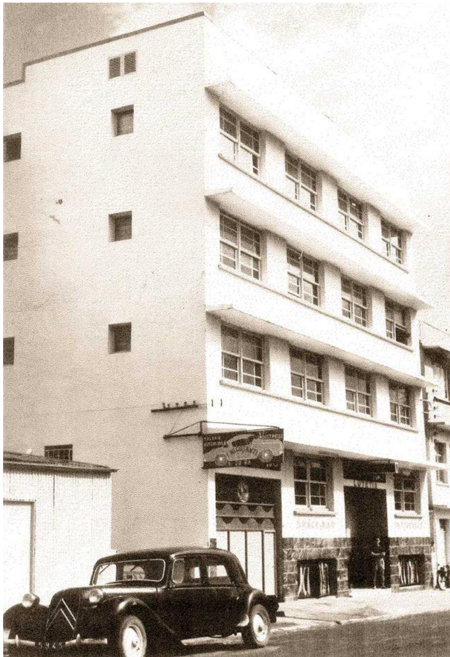
Hotel Lutétia.